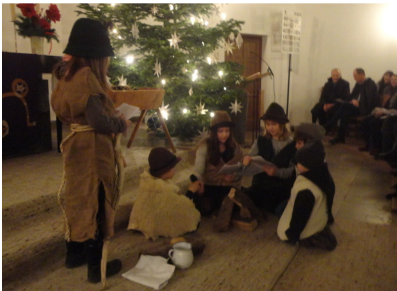
Krippenspiel im Weihnachtsgottesdienst

Diakonisches Werk Haßberge, Fachstelle für pflegende Angehörige, Hauptstr. 12, 96126 Maroldsweisach, Tel. 09532/922313